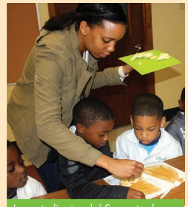
Los estudiantes del Suroeste de Pre-K fueron enseñados a hacer comidas saludables