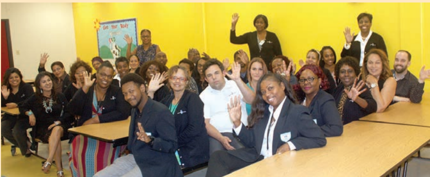
Despedida de Personal del Campus del Noreste