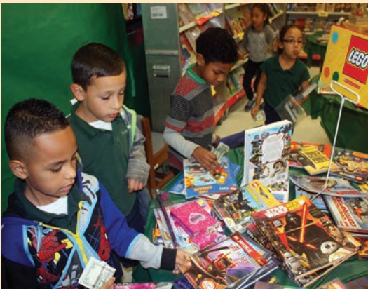
Feria del Libro en el Campus del Este