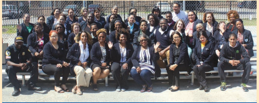
Despedida de Personal del Campus del Este