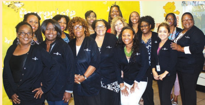
Despedida del personal del Campus de Pre-k del Suroeste