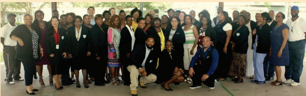
Despedida del personal del Campus del Suroeste