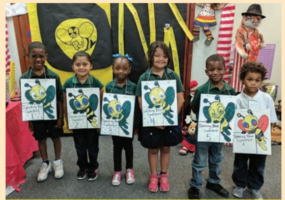
Ganadores del Spelling Bee en el Campus del Suroeste