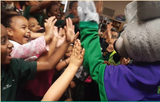
Los estudiantes del noreste corrieron en multitud sobre la mascota de Chuck E. Cheese